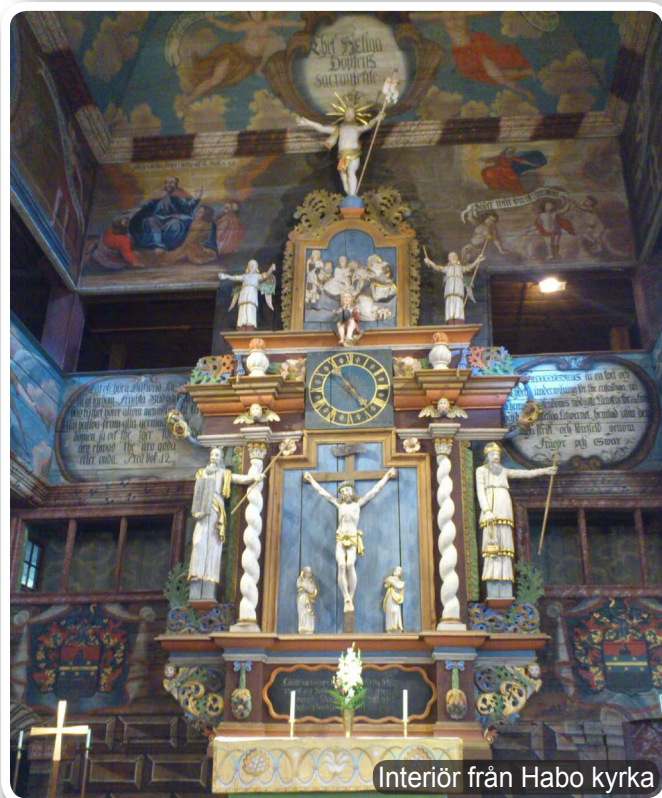
Interiör från Habo kyrka