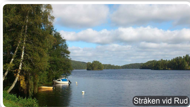
Stråken vid Rud