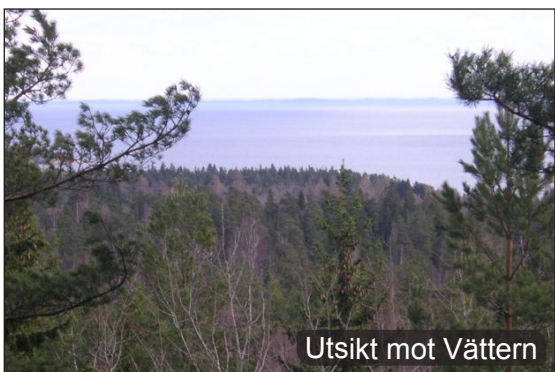
Utsikt mot Vättern

2-3. Efter någon kilometer kommer flera kraftiga stigningar. På toppen av berget finns det en bänk där du kan rasta med en hänförande utsikt över Vättern.