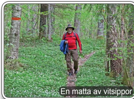
En matta av vitsippor