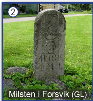
Milsten i Forsvik (GL)

2. Strax söder om slussen står en milsten från 1815 med Karl XIII:s monogram. Här gick den gamla landsvägen. Leden passerar ytterligare en milsten vid norra infarten till Mölltorp.